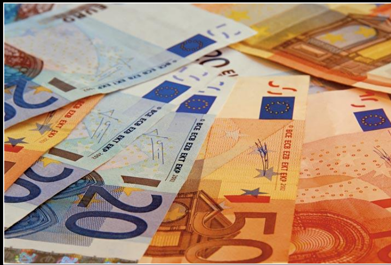
Euro je valuta u 20 zemalja EU-a