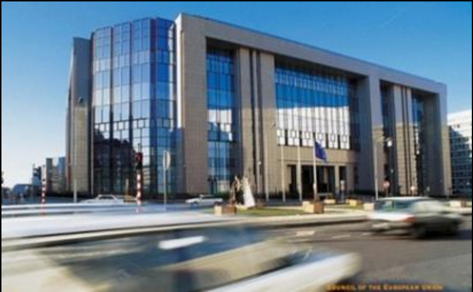
Vijeće Europske unije u Bruxellesu