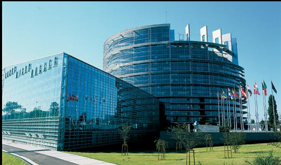
Europski parlament u Strasbourgu