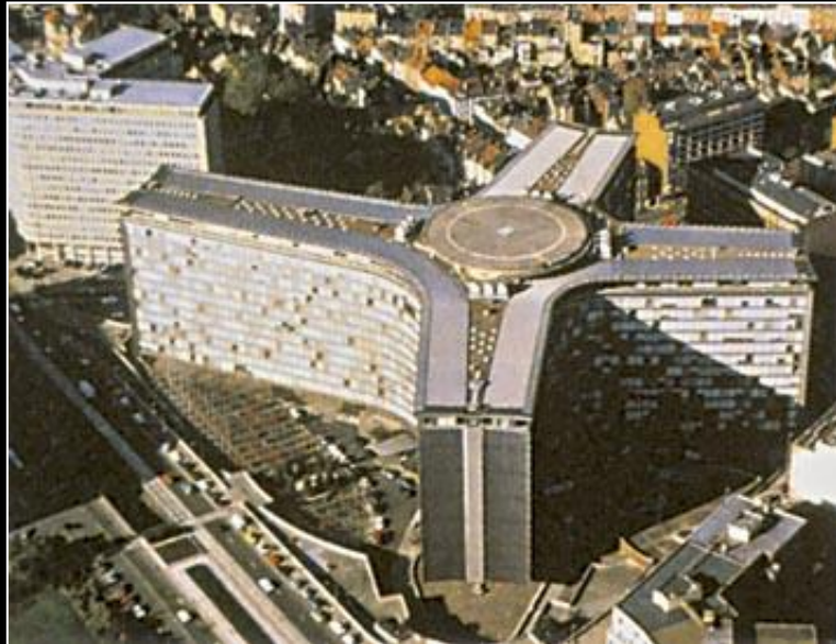
Sjedište EU u Bruxellesu