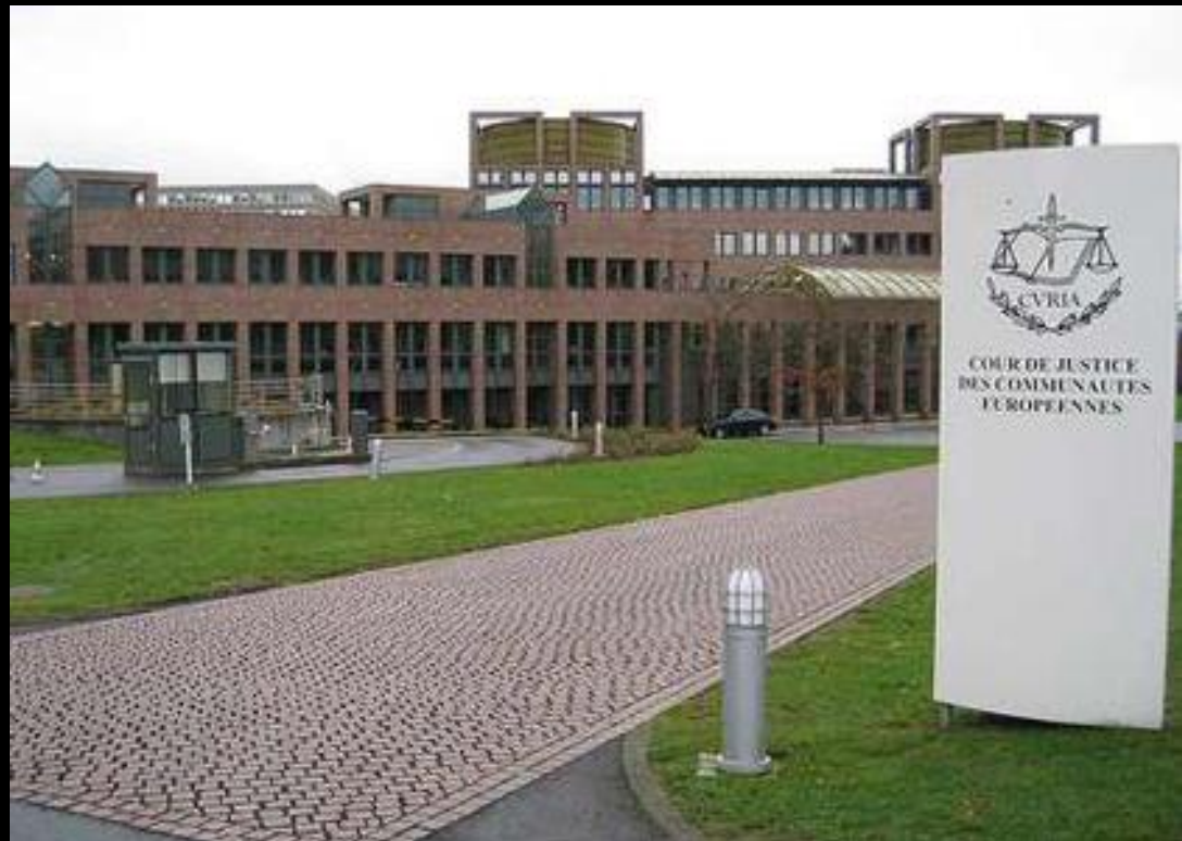
Sud pravde (Luxembourg)