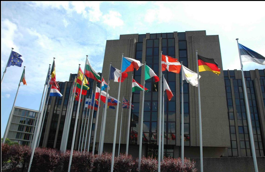
Revizorski su (Luxembourg)