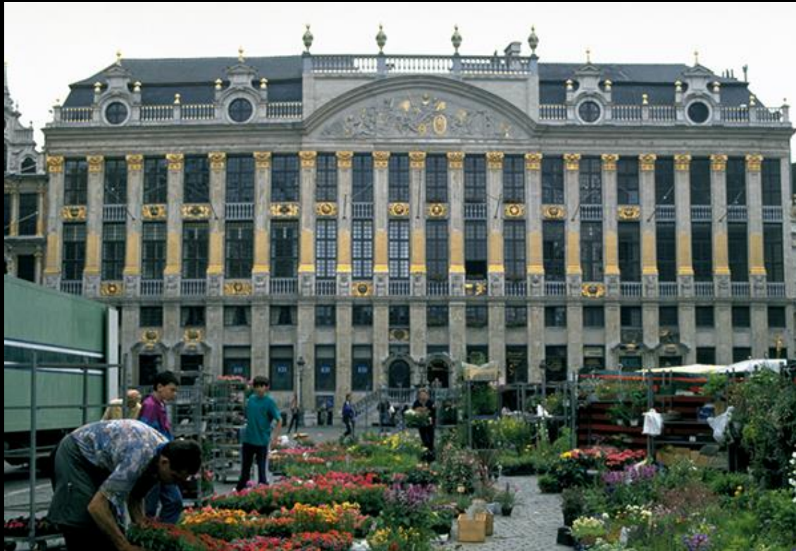
Zgrada Vijeća EU u Bruxellesu