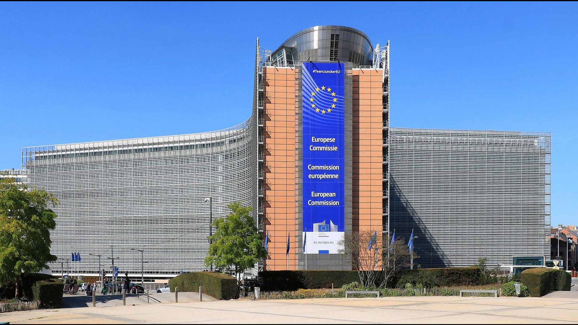
Zgrada Europske komisije u Bruxellesu